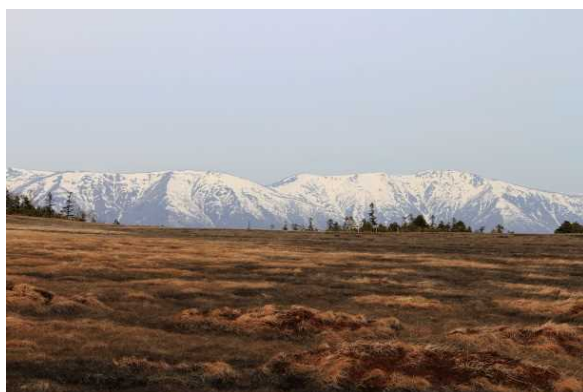
田代山山頂湿原から会津駒ヶ岳方面を望む

参考：関東地区アクティブ・レンジャー日記 http://kanto.env.go.jp/blog/