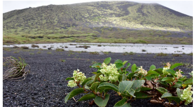
富士箱根伊豆国立公園（大島 三原山）